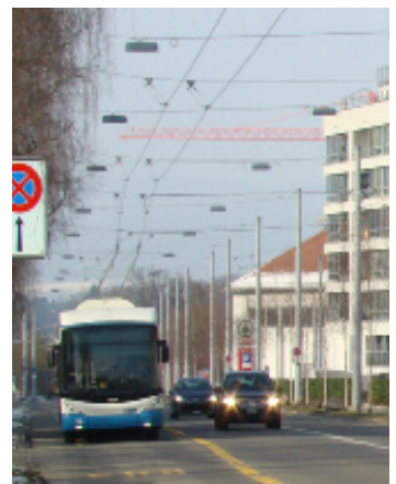
Der Bus der Linie 32 soll durch ein Tram ersetzt werden.

Wann genau das Tram Affoltern realisiert wird, ist zurzeit offen. (pm.)