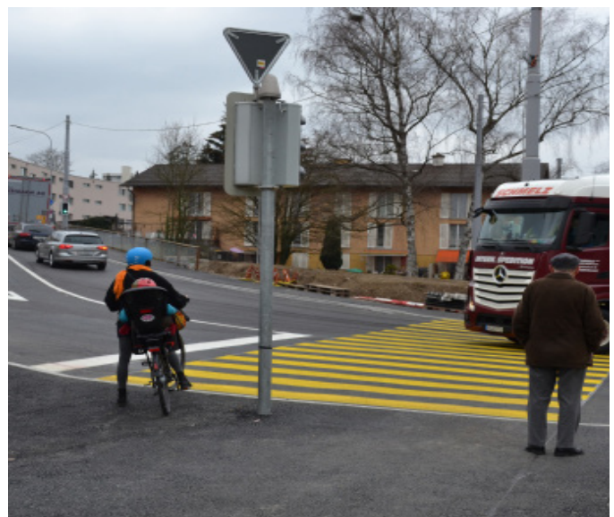
Der Bypass zwischen Furttal- und Wehntalerstrasse funktioniert bestens.

Es wird damit gerechnet, dass die Bauarbeiten zeitig beendet sind. Noch nicht fertig wird im November der neue Autobahnanschluss Affoltern sein. Es werden zusätz-