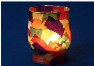
Windlichter basteln Brezeli backen und Guetzlisäckli verzieren